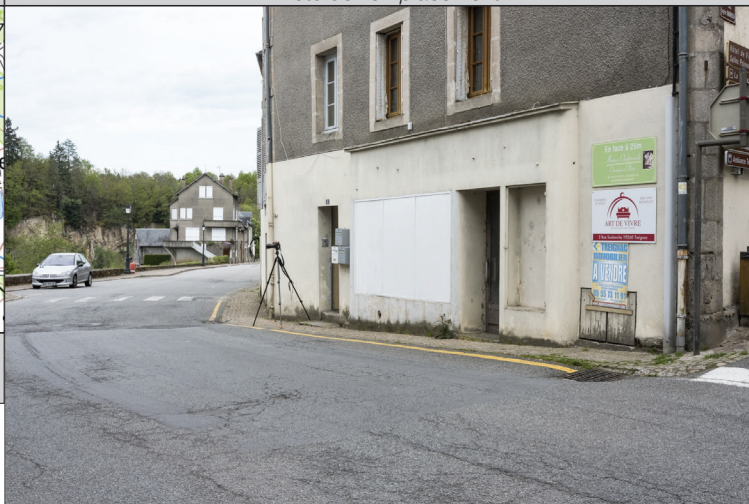
Photo de l'emplacement

Téléchargement du croquis de l'emplacement