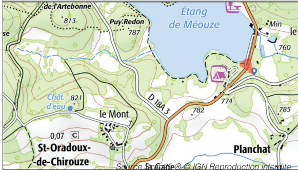
Carte postale ancienne

Positionnement Géoportail Téléchargement