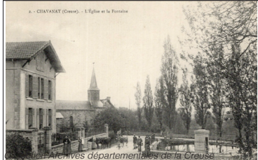
Carte postale ancienne